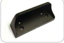
WC_HR50 HR50 sensörü için hava muhafazası